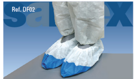
Cubrezapatos Polietileno Azul Talla: única Embalaje: 20 x 100 und.