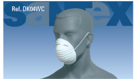
Mascarilla papel 2 capas Color: Blanco Embalaje: 50 x 100 und.